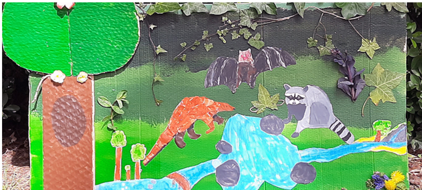
Fable illustrée par une classe de CM1 de l'école Victor Hugo de Montoir-de-Bretagne.

“Fête des fables, faites des fables“, est un concours qui a été organisé pour le 400ème anniversaire de Jean de la Fontaine. Une classe de CM1 de l'école Victor Hugo de Montoir-de-Bretagne a concouru au niveau national, en juillet, dans la catégorie école. Les élèves ont composé et illustré une fable intitulée “Le pangolin, la chauve-souris et le raton laveur .pdf - 30 ko“.