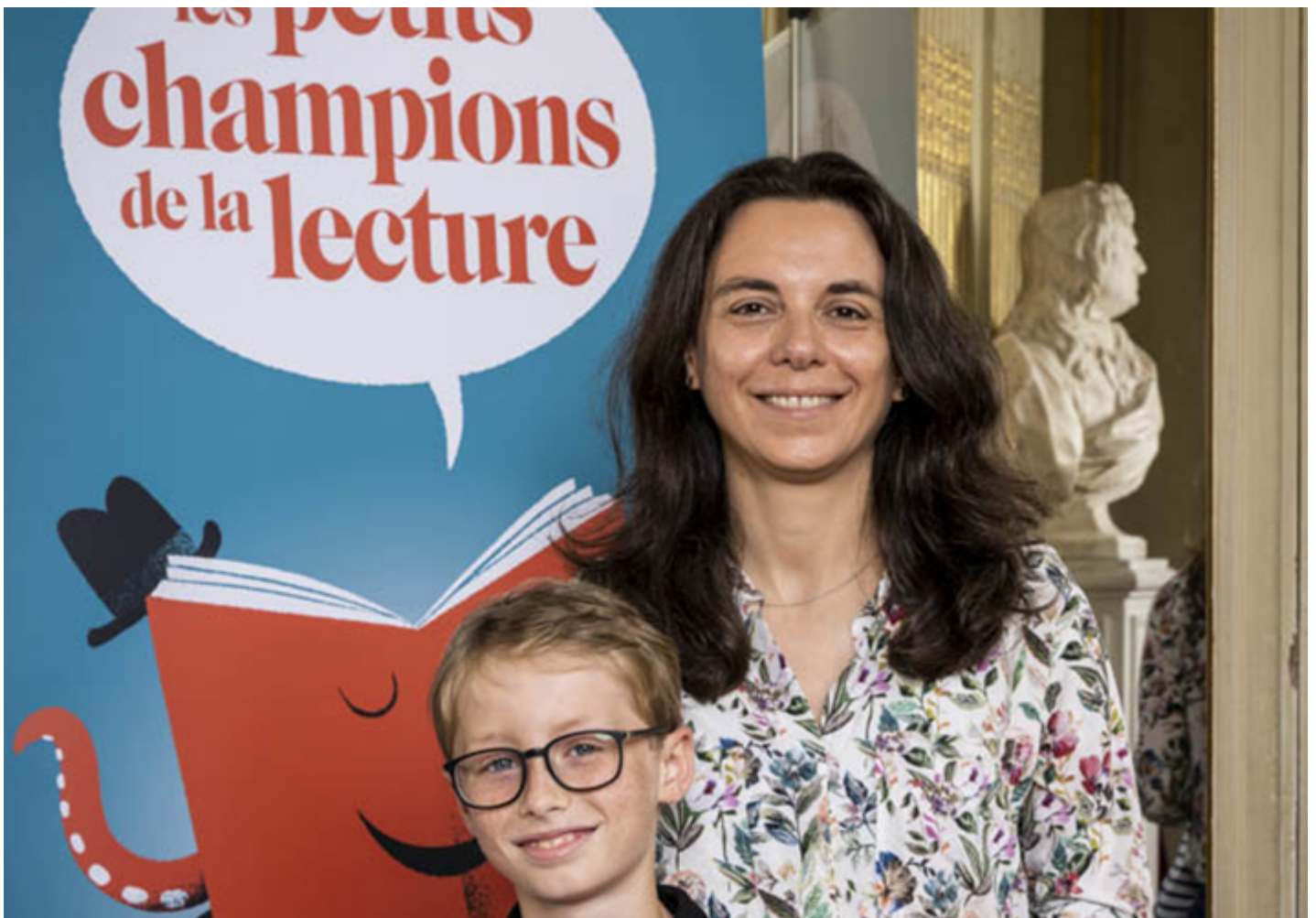
L'école Anne Franck de Couëron a participé à cette finale.

En 2021, 2 150 classes de CM2 étaient mobilisées autour du jeu partout en France. Les Nuits de la lecture organisées par le ministère de la Culture s'associent également au dispositif et les bibliothèques et les librairies accueillent à cette occasion les finales du 1er tour.