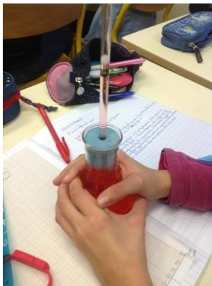
Séance 6 : comprendre la montée du niveau de la mer