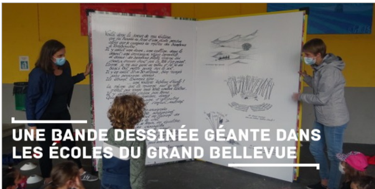
Une bande dessinée géante dans les écoles du Grand Bellevue

UNE BANDE DESSINÉE GÉANTE DANS LES ÉCOLES DU GRAND BELLEVUE