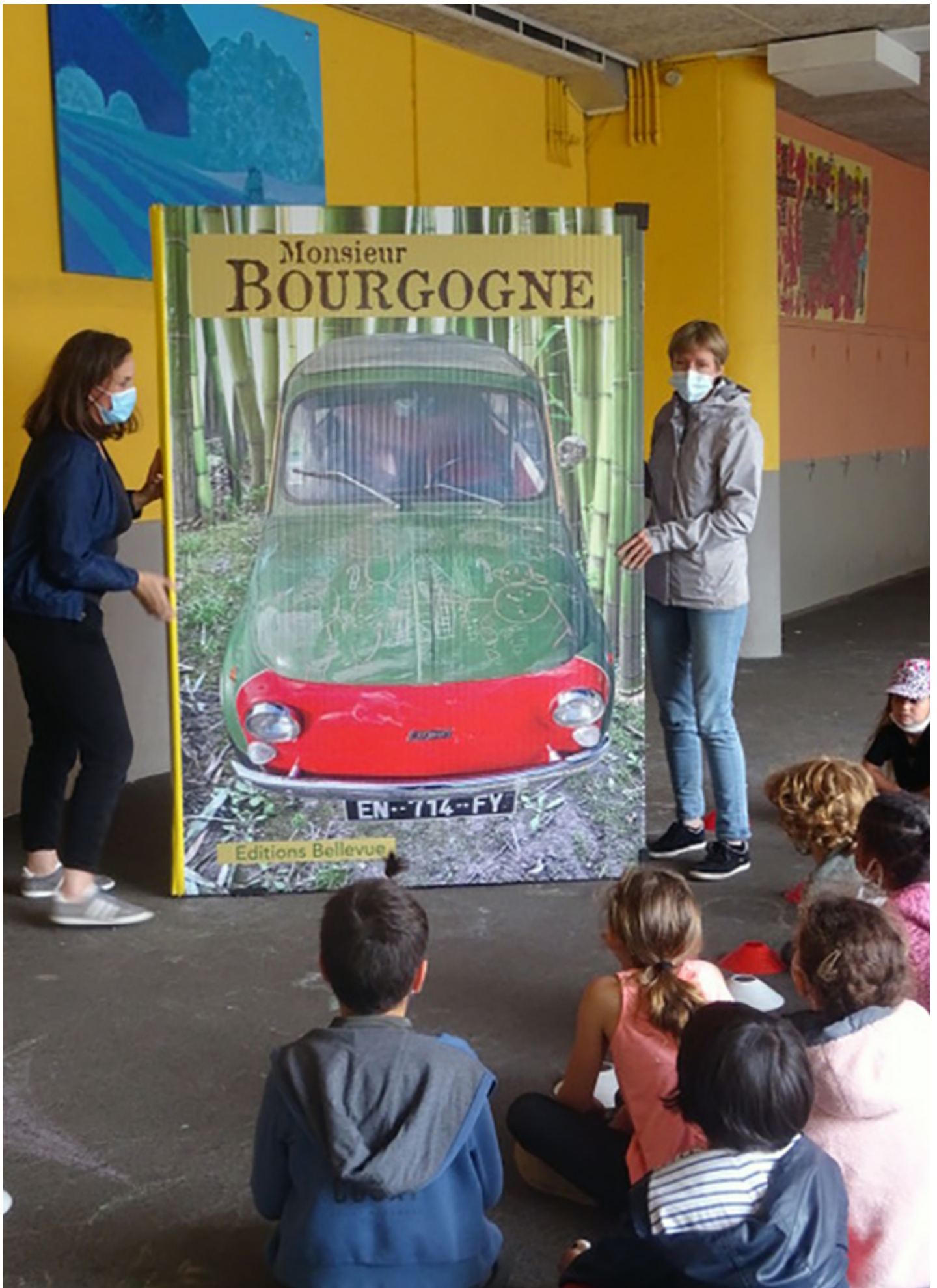
Royal de Luxe dans la cour de l'école du Plessis Cellier