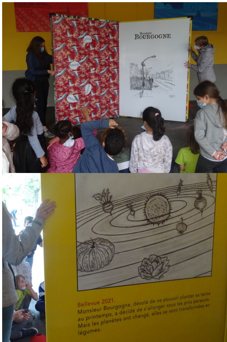
Une bande dessinée géante dans les écoles du Grand Bellevue

Après “ Le Réverbère à nœud “ puis “Monsieur Bourgogne“ , un véritable campeur solitaire venu passer ses vacances sur la façade d'un immeuble en compagnie de sa Fiat 500 accrochée sur une autre façade, les élèves des écoles maternelles et primaires du quartier découvrent dans ce livre (2m de haut sur 1,40m de large) la suite des aventures de Monsieur Bourgogne. Il est dans un désert. Lors de son séjour précédent, il envoyait chaque jour une lettre aux écoles.