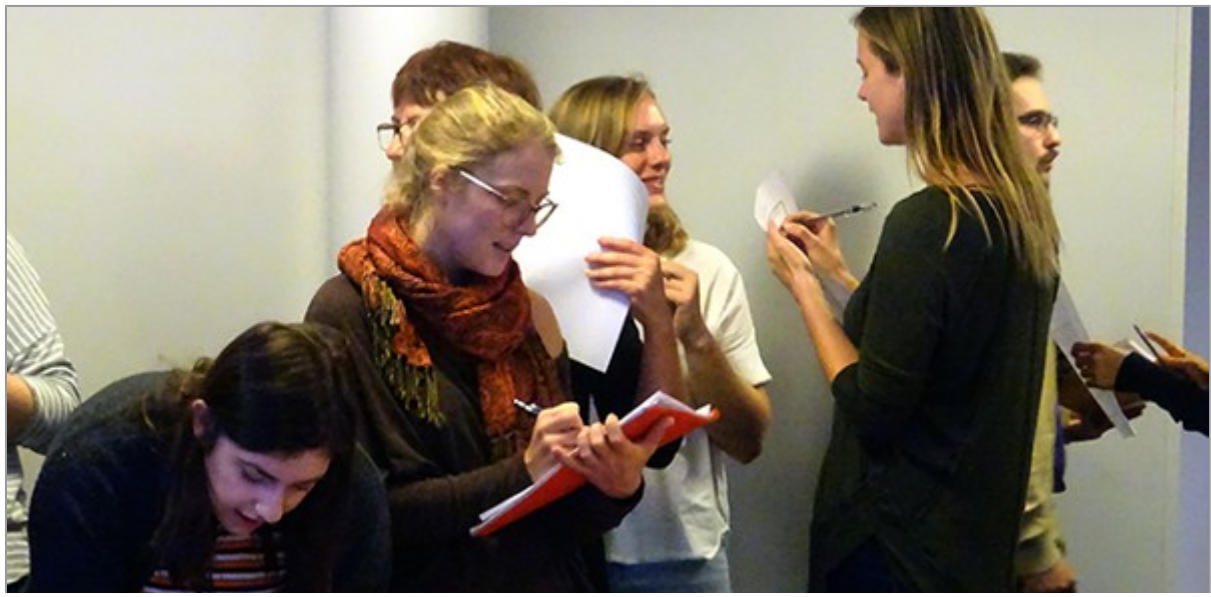
Dix-neuf assistants en langue vivante