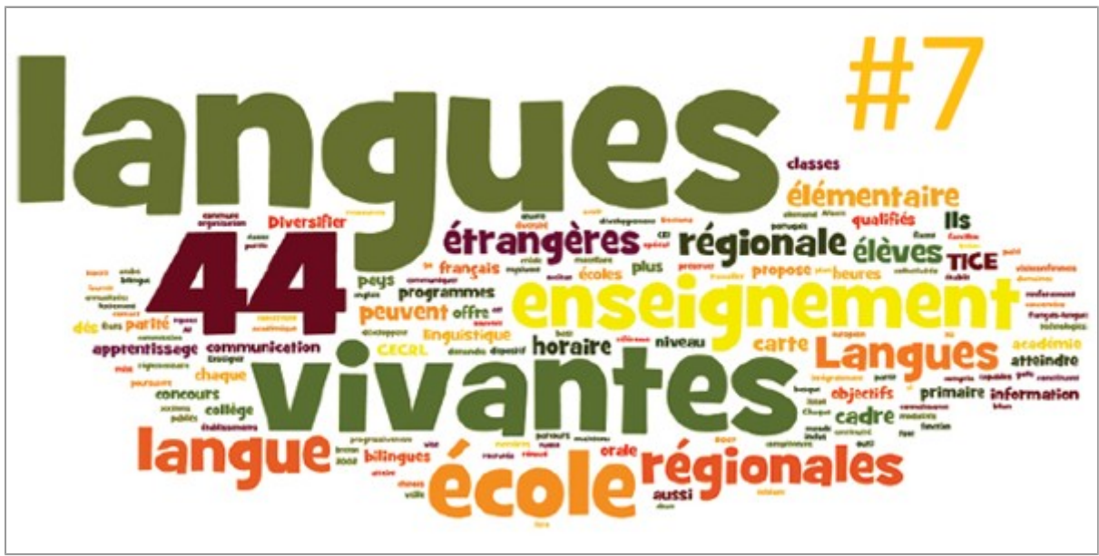
Lettre des langues vivantes # 7 : Enseigner avec des chants et des comptines