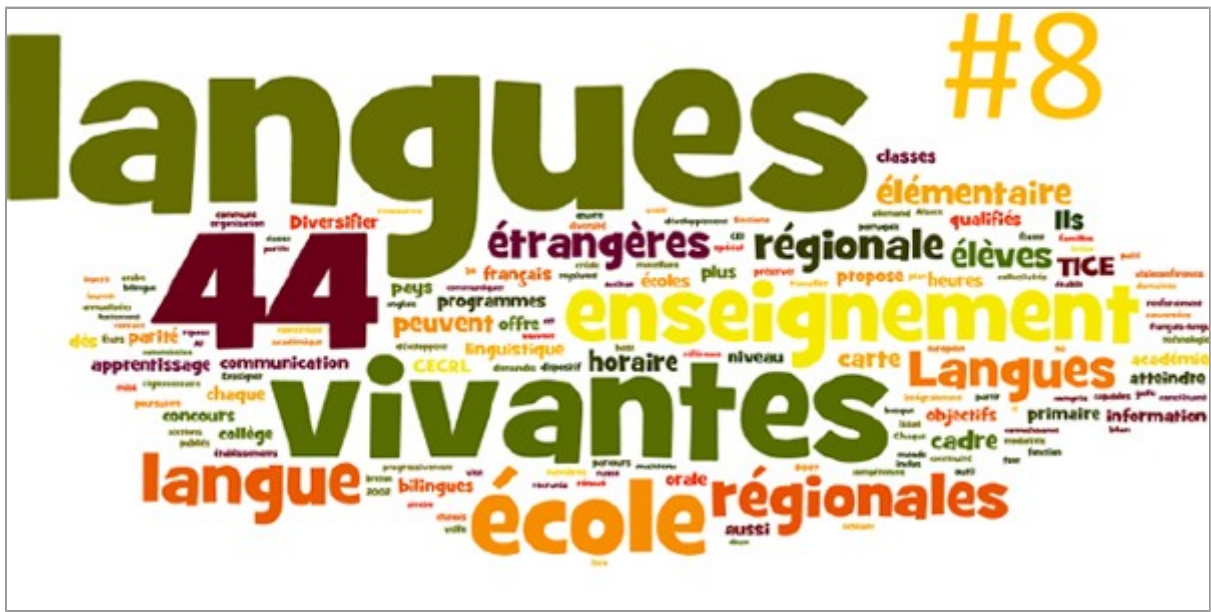
Lettre des langues vivantes # 8 :