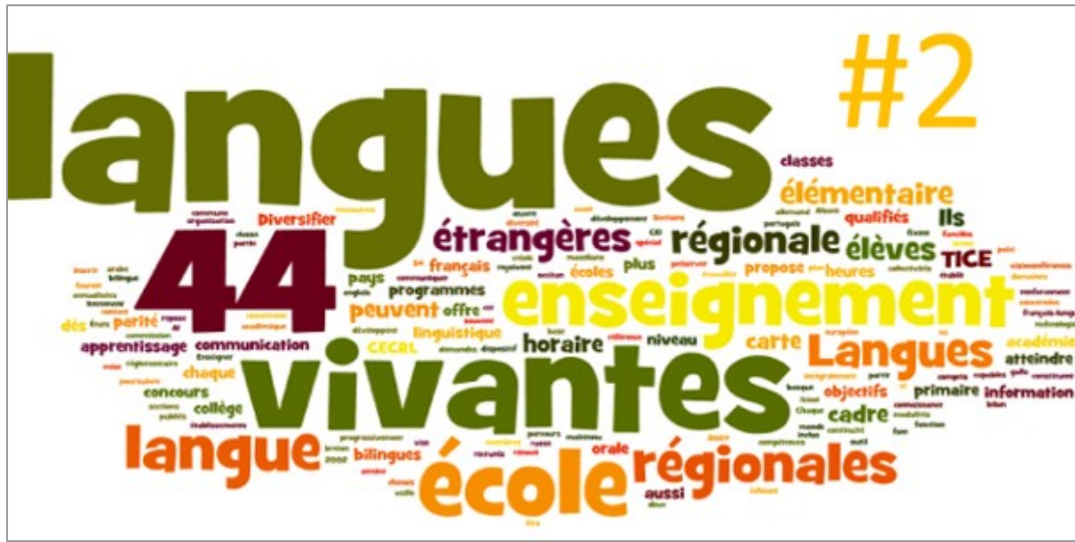
Lettre des langues vivantes # 2 : La place de l'écrit