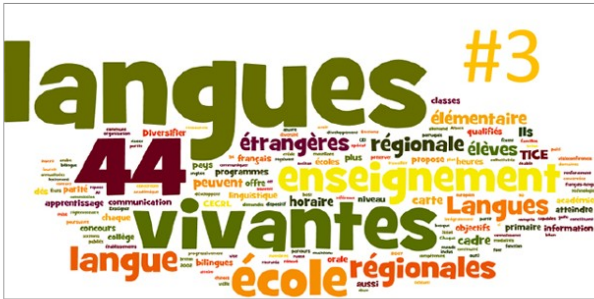
Lettre des langues vivantes # 3 :