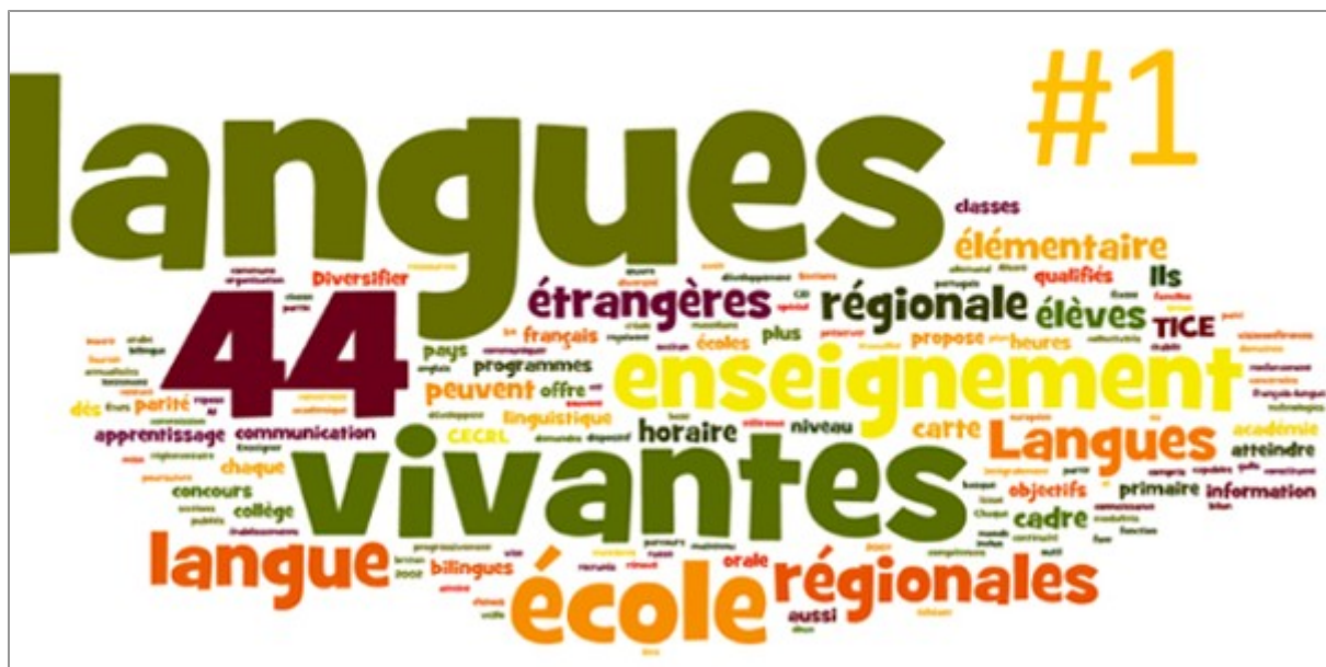
Lettre des langues vivantes # 1 : Le jeu en classe de langues